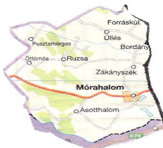
1. kép Az őrs illetékességi területe