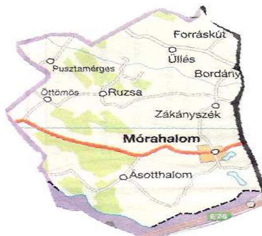
1. kép Az őrs illetékességi területe