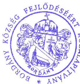
Fodor Csaba kuratórium elnöke